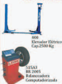
400 Elevador Elétrico Cap.2500 Kg